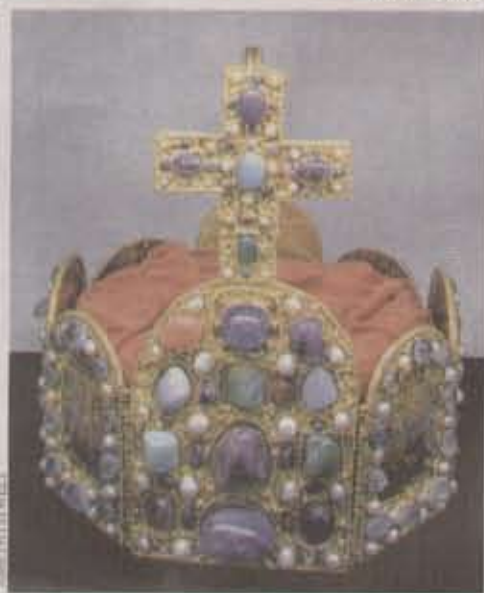
Neu in der Ausstellung: Der mit Mythen beladene Edelstein war beliebt bei Kirche und Kaiser

INFO Amethyst Welt Maissau An der Horner Bundesstraße, 3712 Maissau Telefon 0 29 58/84 8 40 Ganzjährig geöffnet, täglich von 9–17 Uhr Mai bis September bis 18 Uhr